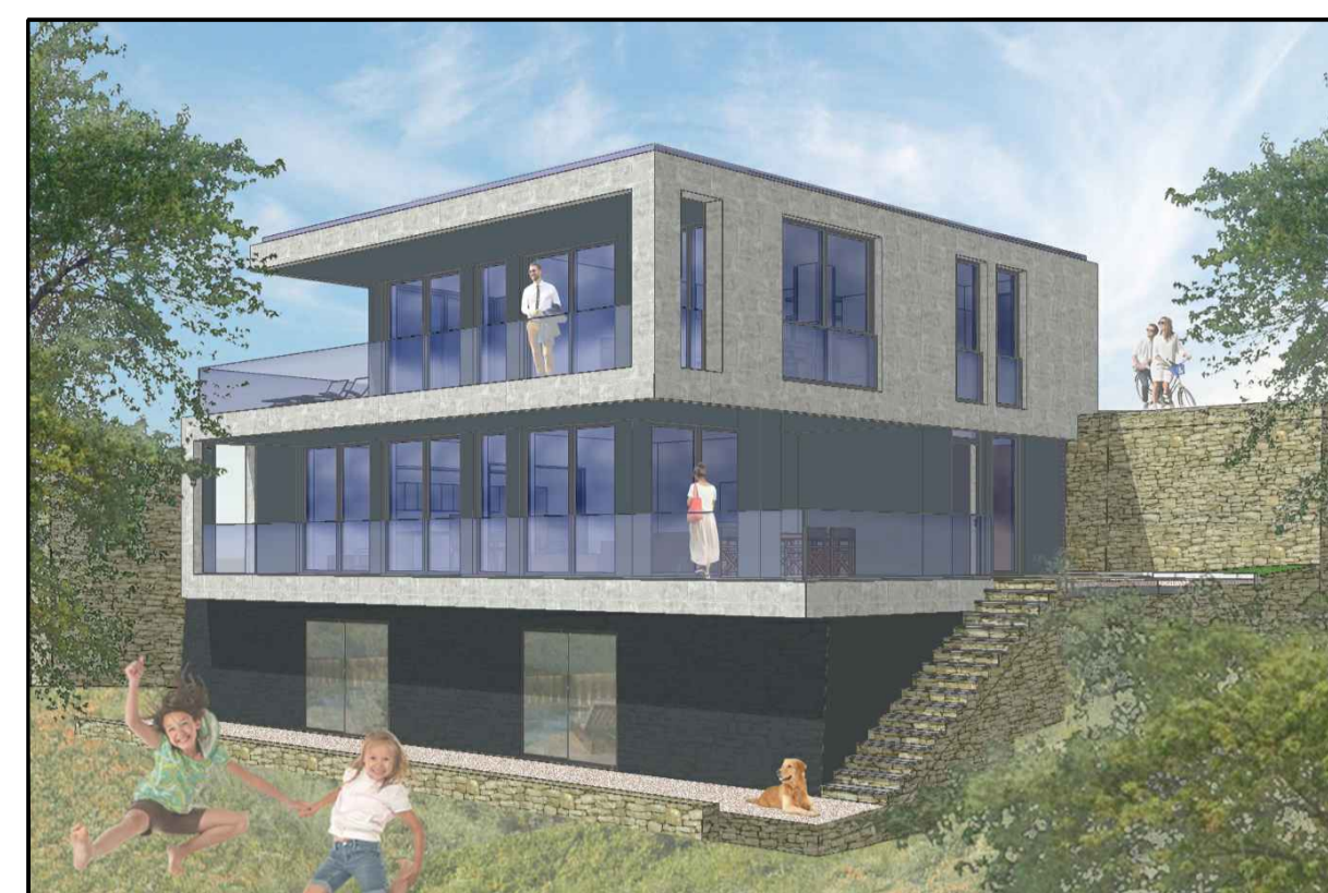
TIP A -kaskadno