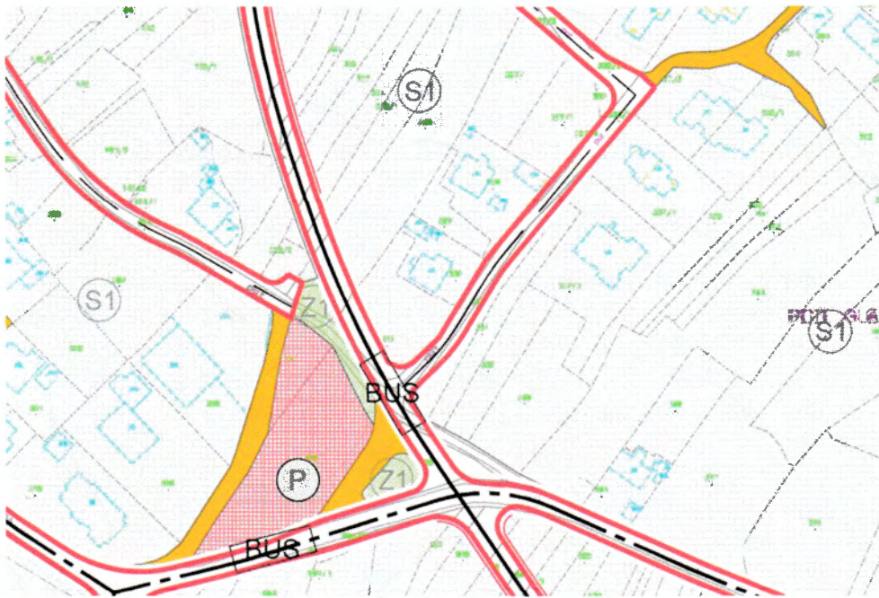
Novi predlog plana naselja N-2.